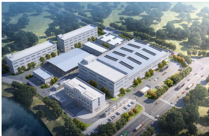
Ya'an Guangming Paite Precious Metal Co., Ltd.