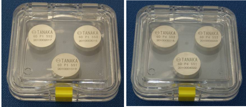
백금(왼쪽)과 팔라듐(오른쪽)의 표준 물질

기기 교정, 측정법 평가, 측정 대상 물질의 값을 부여(분석)하는 데 사용하기 위한 단일 또는 복수의 특성값이 확정된 균일한 물질을 의미. 각종 화학 분석 등에서 정량적인 눈금의 역할을 다하는 동시에 기기의 사용조건, 특성, 분석자의 차이 등을 보정하는 역할을 담당한다.