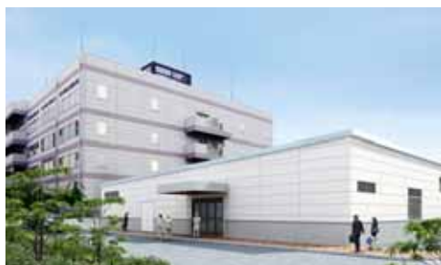
專用工廠的示意圖