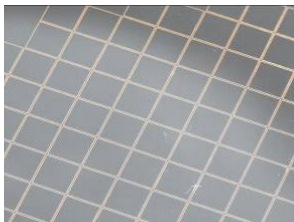
印刷於 8 吋晶圓基板上之「AuRoFUSE™」的密封外框外觀（200 微米寬）。